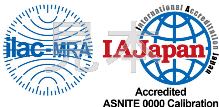
図1 認定事業者が使用できる認定シンボル

用及び認定要求事項に適合している旨の記載ができる。認定シンボルを使用する場合は、別に定める「IAJapan認定シンボルの使用及び認定の主張等に関する方針(URP15)」に掲げる事項を遵守すること。